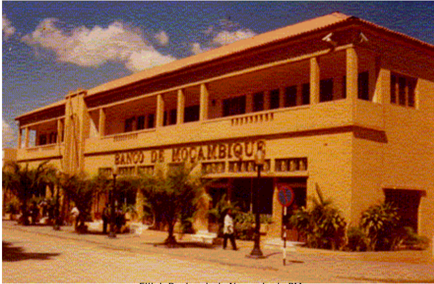
Filial Regional de Nampula do BM