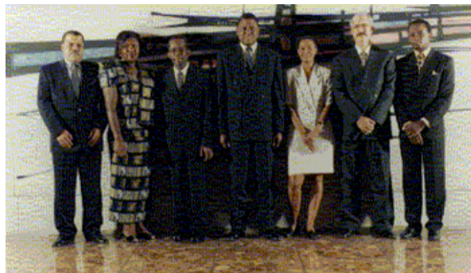
Na imagem os membros do Conselho de Administração em exercício no início do ano 2000